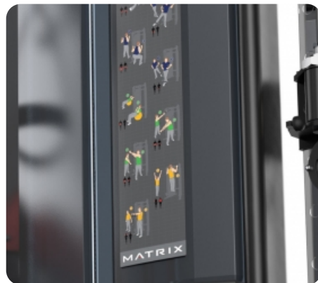
Наглядные карты выполнения упражнений показывают упражнения на основные мышечные группы и правильное положение пользователя в ходе тренировки