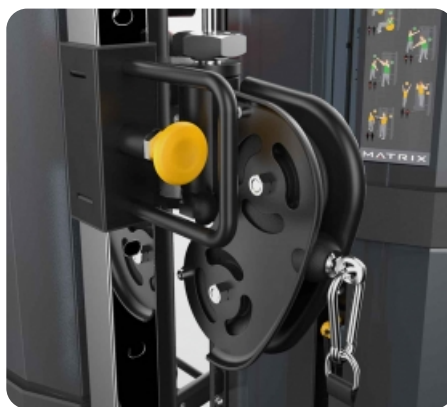
Регулировка уровня нагрузки одной рукой плюс дополнительная защита шкивов