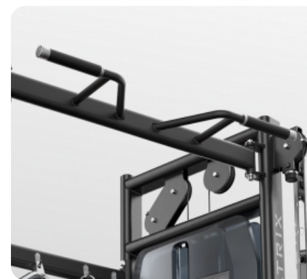
Оптимальное по высоте расположение турника для подтягиваний с несколькими вариантами хвата