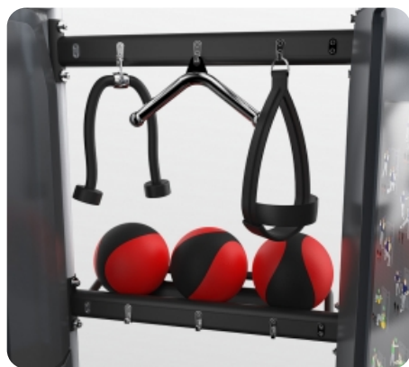
Полки и крюки предназначены для размещения и хранения аксессуаров и рукоятей

Теги: Профессиональные силовые тренажеры , Мультистанции силовые тренажеры , Силовые тренажеры Matrix