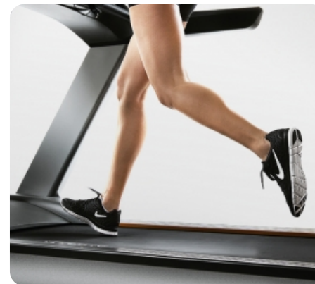
Амортизационная система настроена на оптимальную жесткость, на любых скоростных режимах дорожка максимально комфортна и безопасна