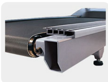
Двухслойное коммерческое полотно Nabasit™ с рабочей поверхностью 152*56 см.