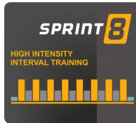
Уникальная интервальная программа Sprint 8, разработанная знаменитым спортсменом Филом Кэмпбеллом