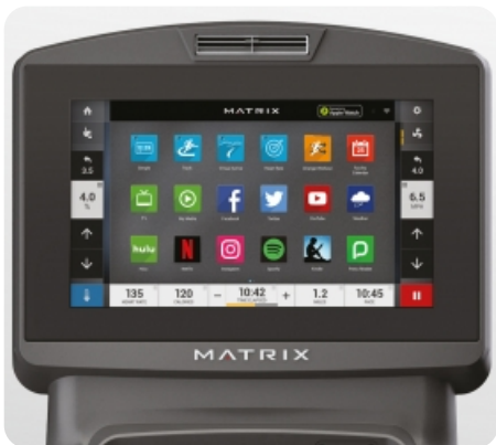
16-ти дюймовый сенсорный TFT-LCD дисплей Vista Clear™ на ОС Android с WI-FI доступом к различным интернет приложениям