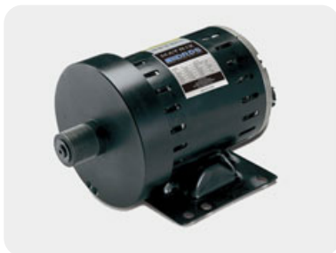
Двигатель собственной разработки с адаптивной выходной мощностью обеспечивает абсолютно равномерное движение полотна для пользователей любого веса на всем скоростном диапазоне