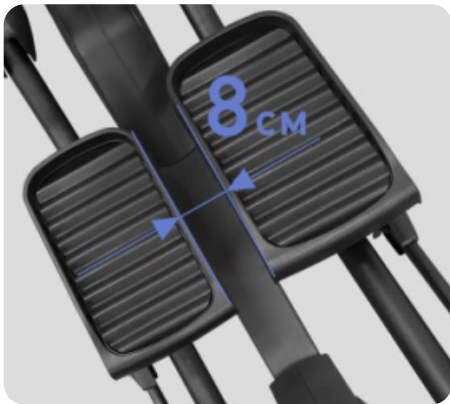
СУПЕРМАЛЫЙ Q-ФАКТОР E.S.Q.F.™ (8 CM)