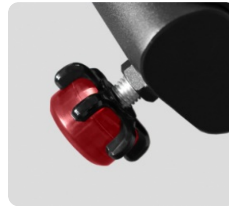
КОМПЕНСАТОРЫ НЕРОВНОСТЕЙ ПОЛА