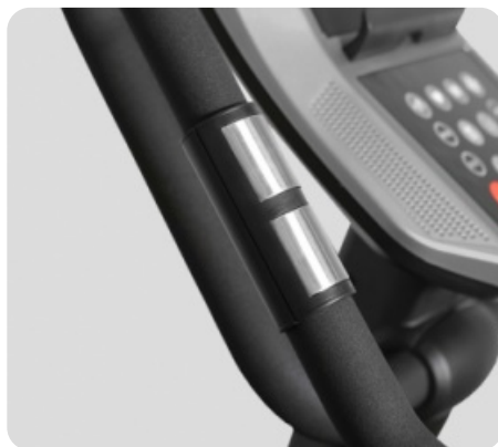
СЕНСОРНЫЕ ДАТЧИКИ ПУЛЬСА