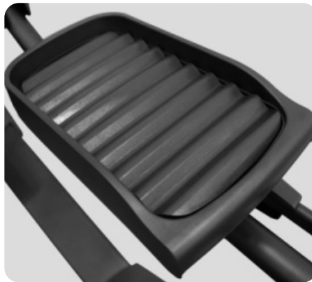
АНТИСКОЛЬЗЯЩИЕ ПЕДАЛИ УВЕЛИЧЕННОГО РАЗМЕРА