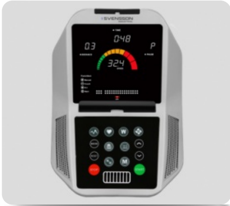
ДИСПЛЕЙ ПРОФЕССИОНАЛЬНОГО УРОВНЯ