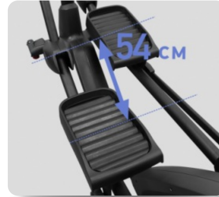
ДЛИНА ШАГА 54 CM