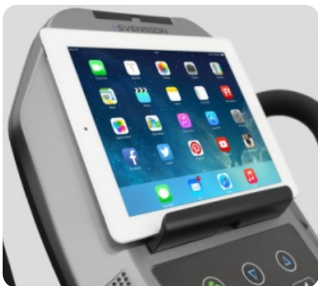
ПОДСТАВКА ПОД ПЛАНШЕТ ИЛИ СМАРТФОН