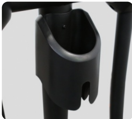
ДЕРЖАТЕЛЬ ДЛЯ ЕМКостей