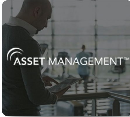
"Облачный" сервис дистанционного мониторинга и управления оборудованием