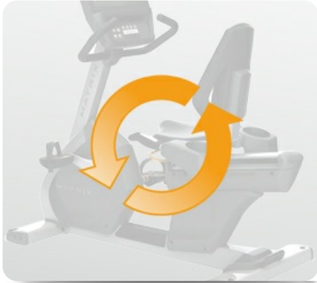
Независимость от электросетей для экономии электроэнергии и оптимального расположения