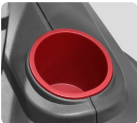
ДЕРЖАТЕЛЬ ДЛЯ ЕМКостей