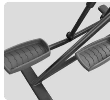
ДЛИНА ШАГА ДО 73 СМ