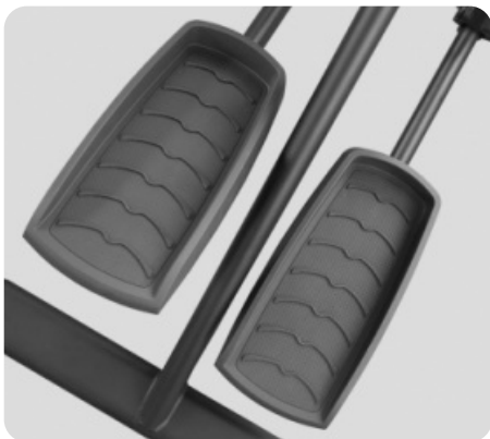
СУПЕРМАЛЫЙ Q-ФАКТОР E.S.Q.F.™ (9 CM)