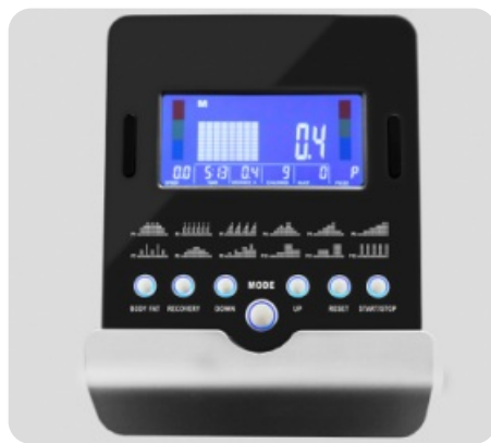
БУКВЕННО-ЦИФРОВОЙ LCD-ДИСПЛЕЙ ДИАГОНАЛЬЮ 14,5 СМ

Теги: Полупрофессиональные эллиптические тренажеры , Эллиптические тренажеры Svensson Industrial