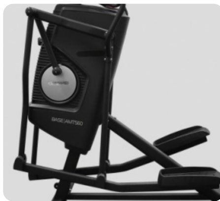
НЕСКОЛЬКО ТИПОВ ТРЕНАЖЕРОВ В ОДНОМ