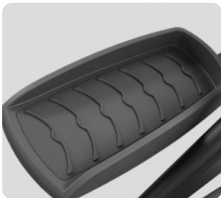
АНТИСКОЛЬЗЯЩИЕ ПЕДАЛИ УВЕЛИЧЕННОГО РАЗМЕРА